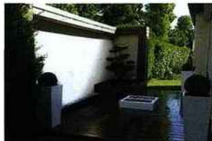
Xavier Poillot, le designer de cet espace, est l'un des adhérents « Expert Jardins »

1 500 entrepreneurs du paysage ont déjà adhéré au label lancé au printemps dernier s'engageant à tenir des obligations telles que la gestion éco responsable des